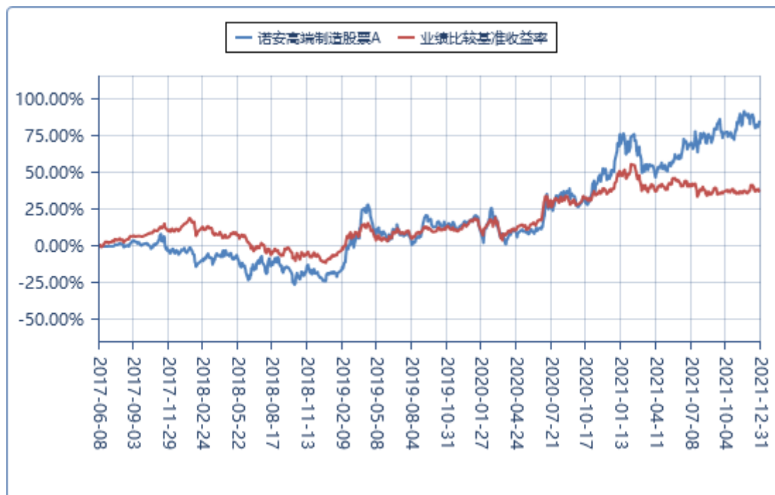
诺安高端制造股票 C