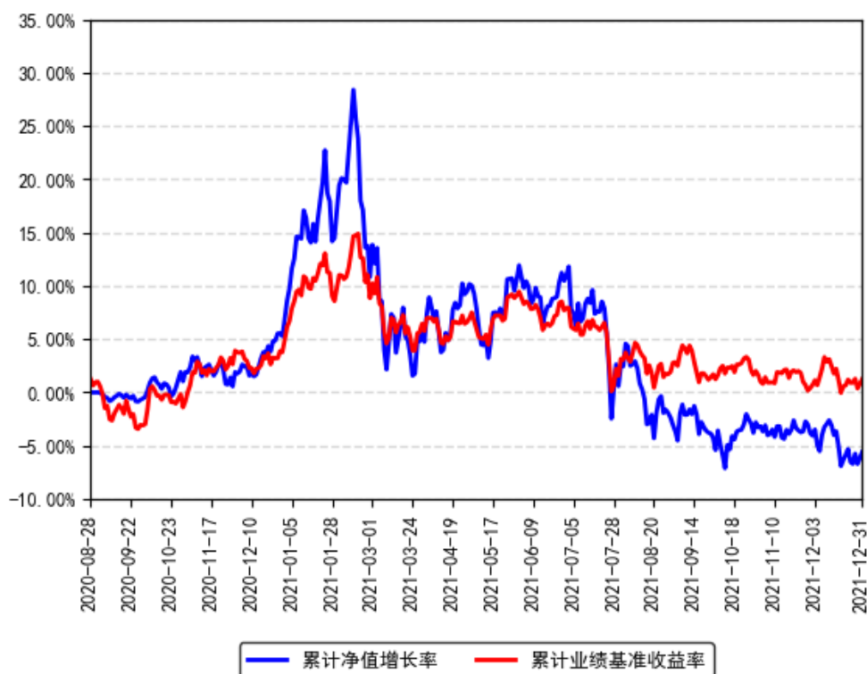
南方创新驱动混合A累计净值增长率与同期业绩比较基准收益率的历史走势对比图