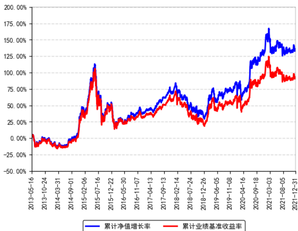
南方300联接A累计净值增长率与同期业绩比较基准收益率的历史走势对比图