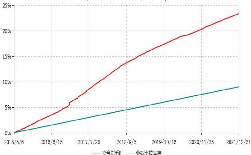
嘉合货币B累计净值收益率与业绩比较基准收益率历史走势对比图 (2015年05月06日-2021年12月31日)