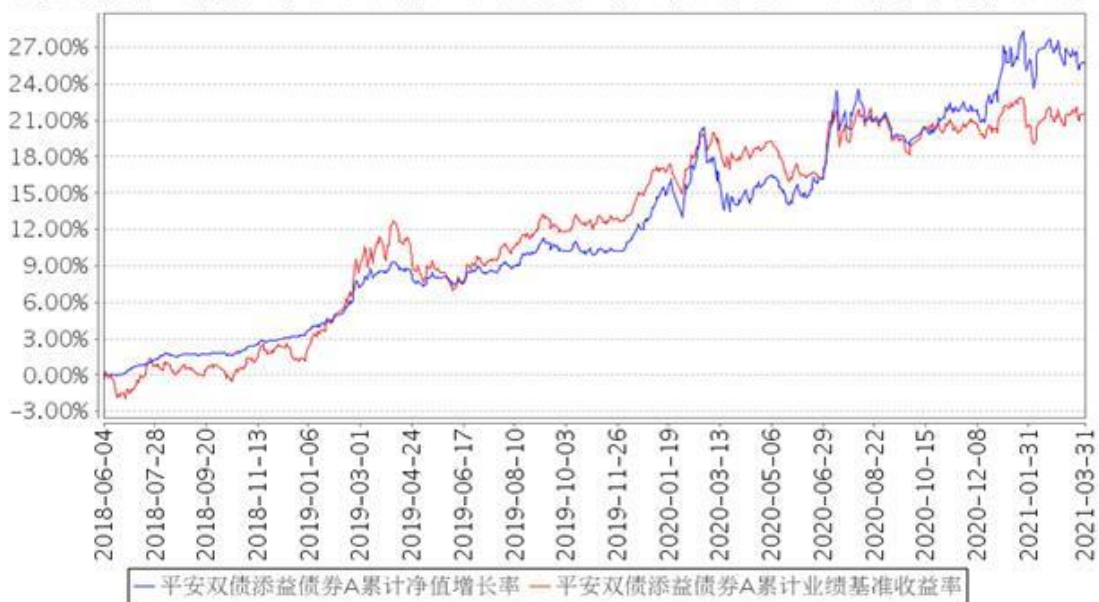
平安双债添益债券A累计净值增长率与同期业绩比较基准收益率的历史走势对比图