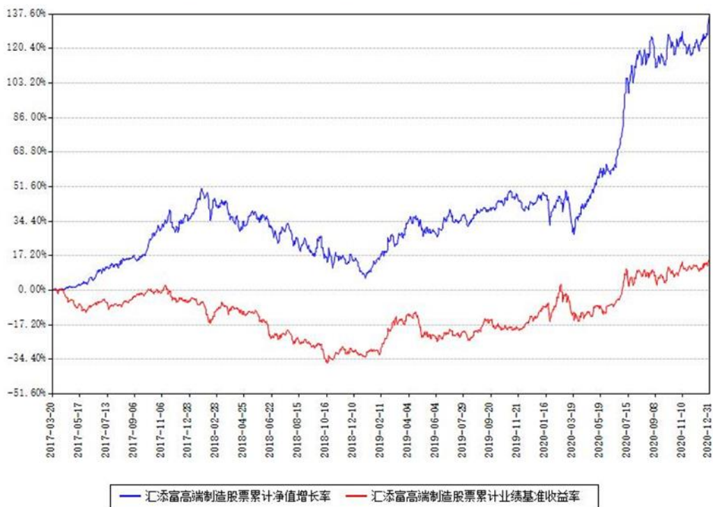
汇添富高端制造股票累计净值增长率与同期业绩基准收益率对比图