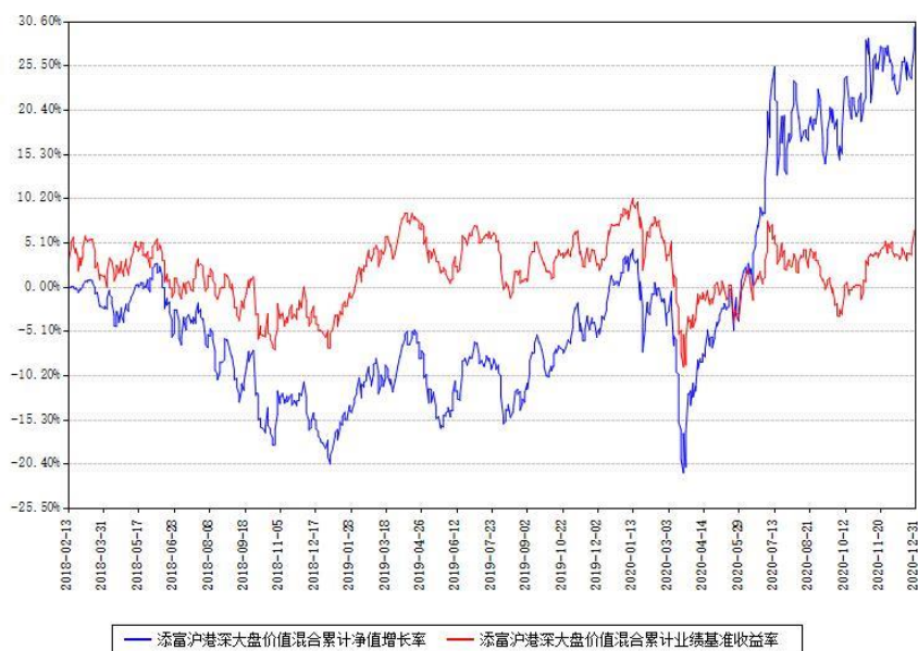
添富沪港深大盘价值混合累计净值增长率与同期业绩基准收益率对比图

(二) 自基金合同生效以来基金累计净值增长率变动及其与同期业绩比较基准收益率变动的比较图