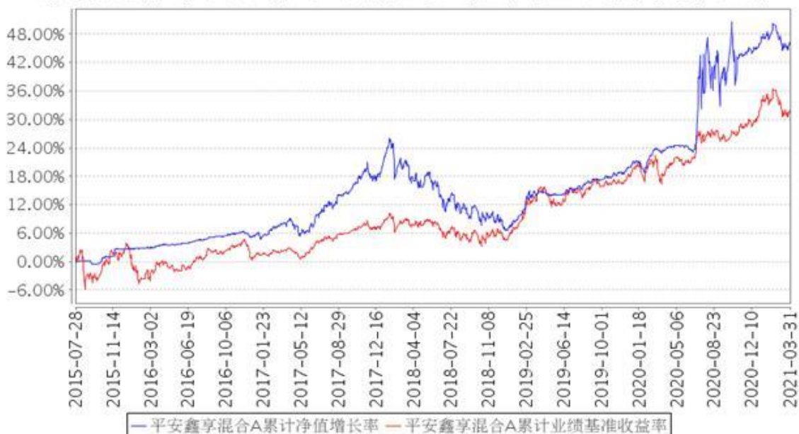
平安鑫享混合A累计净值增长率与同期业绩比较基准收益率的历史走势对比图