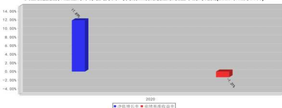
兴全恒鑫债券A基金每年净值增长率与同期业绩比较基准收益率的对比图(2020年12月31日)