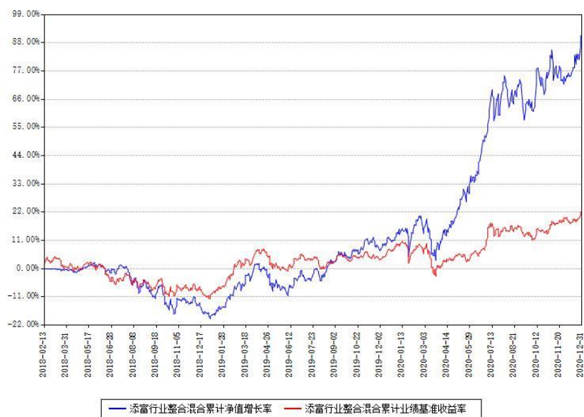
添富行业整合混合累计净值增长率与同期业绩基准收益率对比图