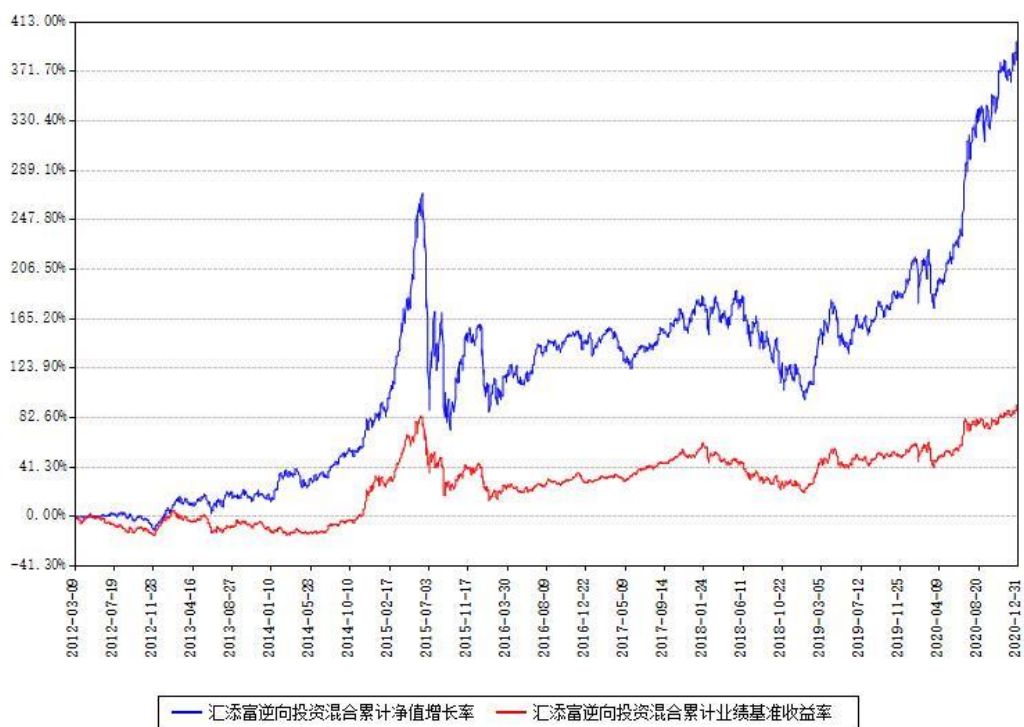
汇添富逆向投资混合累计净值增长率与同期业绩基准收益率对比图