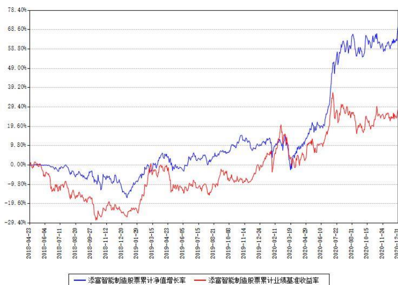
添富智能制造股票累计净值增长率与同期业绩基准收益率对比图

(二) 自基金合同生效以来基金累计净值增长率变动及其与同期业绩比较基准收益率变动的比较图