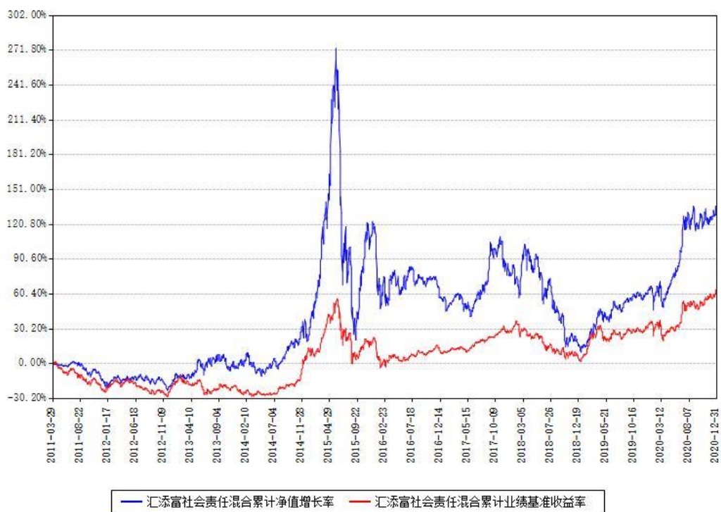
汇添富社会责任混合累计净值增长率与同期业绩基准收益率对比图