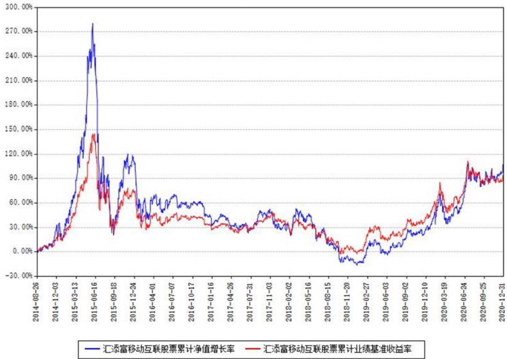
汇添富移动互联股票累计净值增长率与同期业绩基准收益率对比图