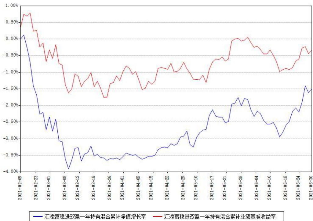
汇添富稳进双盈一年持有混合累计净值增长率与同期业绩基准收益率对比图