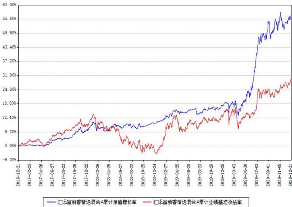
汇添富新睿精选混合A累计净值增长率与同期业绩基准收益率对比图