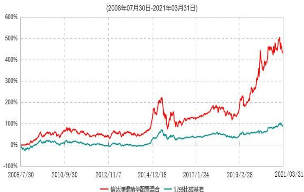
信达澳银精华灵活配置混合型证券投资基金累计净值增长率与业绩比较基准收益率历史走势对比图

注：1、本基金合同于 2008 年 7 月 30 日生效，2008 年 8 月 29 日开始办理申购、赎回业务。