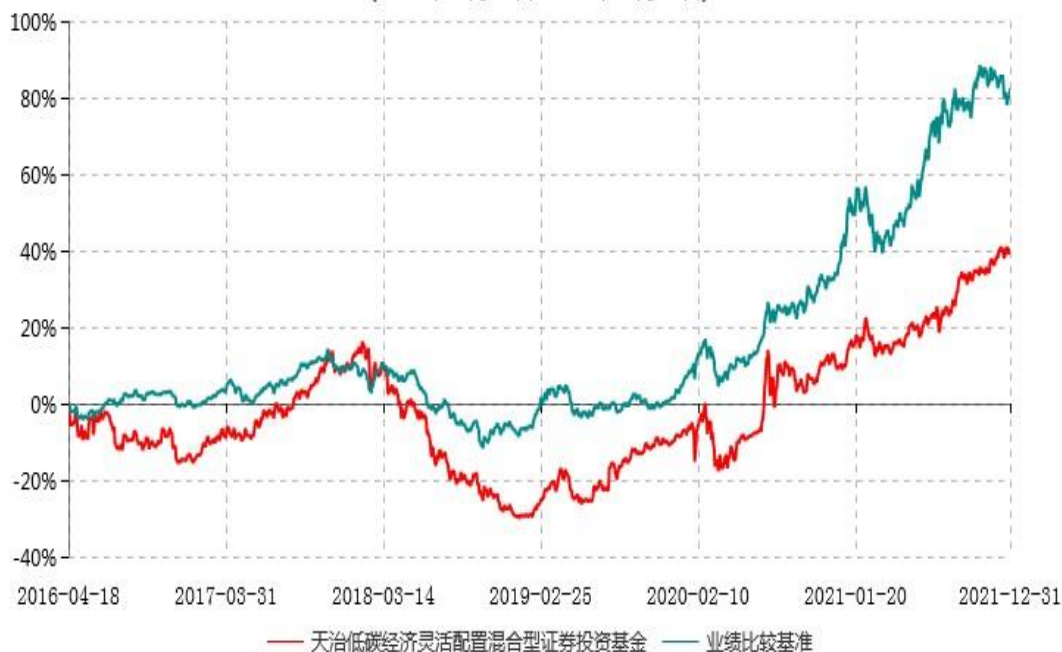
天治低碳经济灵活配置混合型证券投资基金累计净值增长率与业绩比较基准收益率历史走势对比图 (2016年04月18日-2021年12月31日)