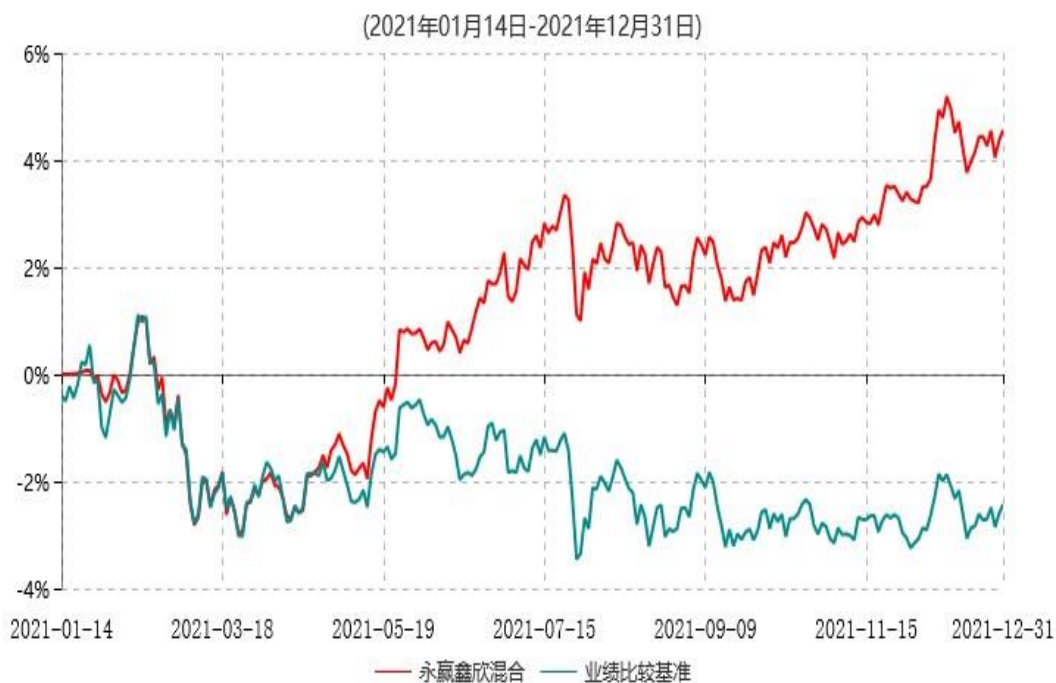
永赢鑫欣混合型证券投资基金累计净值增长率与业绩比较基准收益率历史走势对比图

注：1、本基金合同生效日为2021年1月14日，截至本报告期末本基金合同生效未满一年； 2、本基金在六个月建仓期结束时，各项资产配置比例符合合同约定。