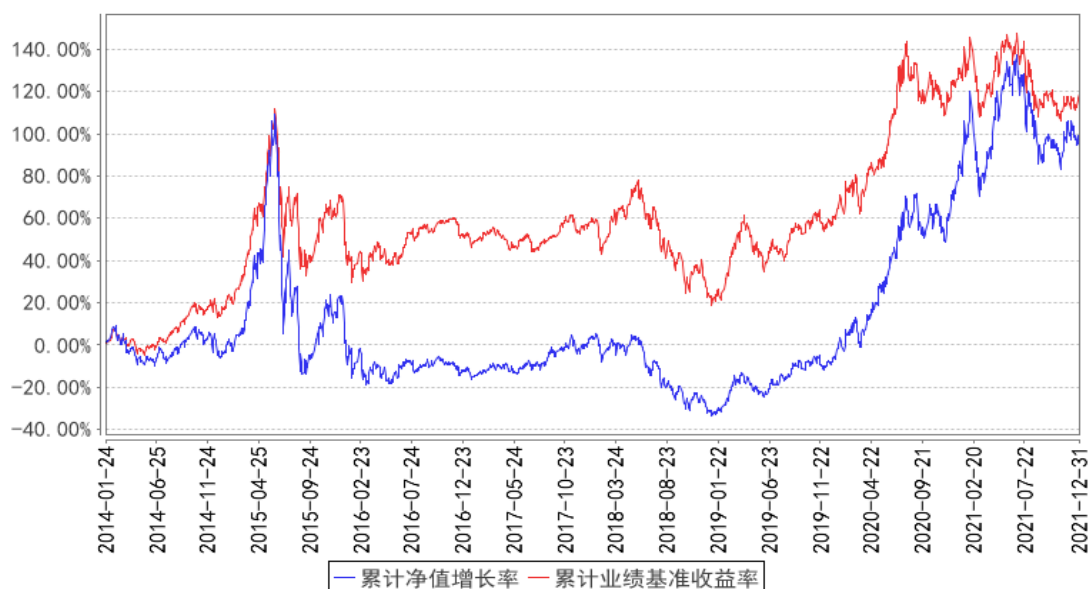
大成健康产业混合累计净值增长率与同期业绩比较基准收益率的历史走势对比图

注：1、根据中国证监会 2014 年 1 月 24 日下发的《关于大成中证 500 沪市交易型开放式指数证券投资基金联接基金基金份额持有人大会决议备案的回函》（基金部函[2014]51 号），大成中证 500 沪市交易型开放式指数证券投资基金联接基金转型为大成健康产业股票型证券投资基金，修改基金合同中的基金名称、基金类别、基金的投资目标、投资范围、投资理念和投资策略、业绩比较