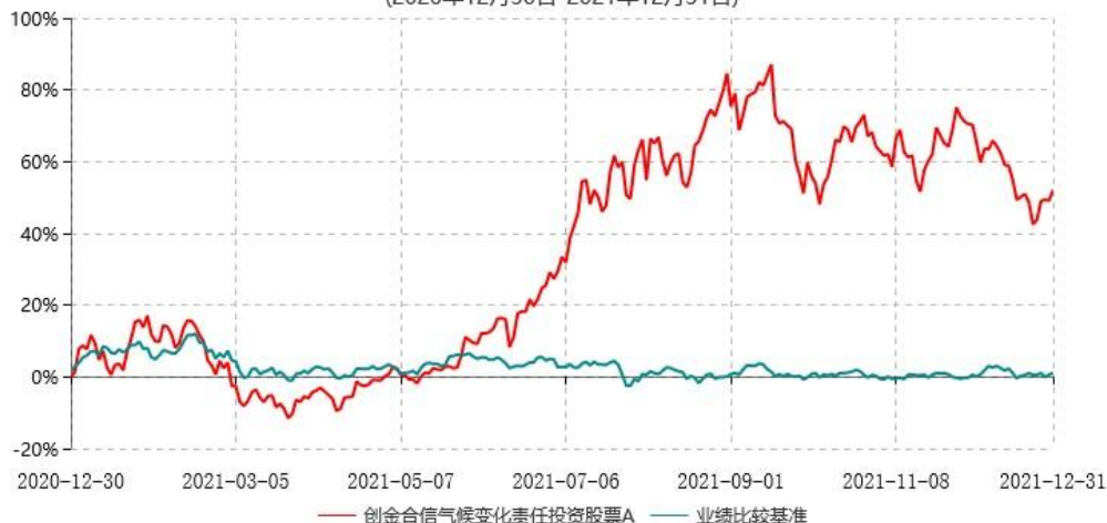
创金合信气候变化责任投资股票A累计净值增长率与业绩比较基准收益率历史走势对比图 (2020年12月30日-2021年12月31日)