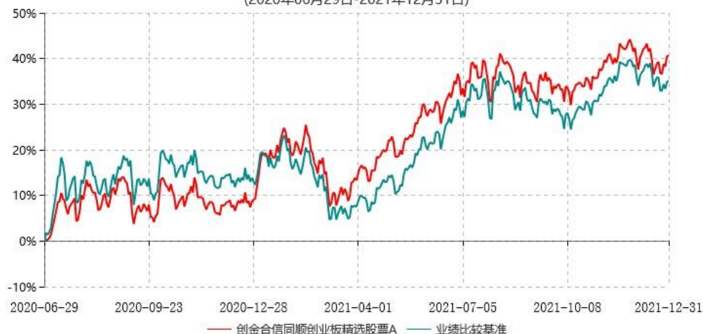
创金合信同顺创业板精选股票A累计净值增长率与业绩比较基准收益率历史走势对比图 (2020年06月29日-2021年12月31日)