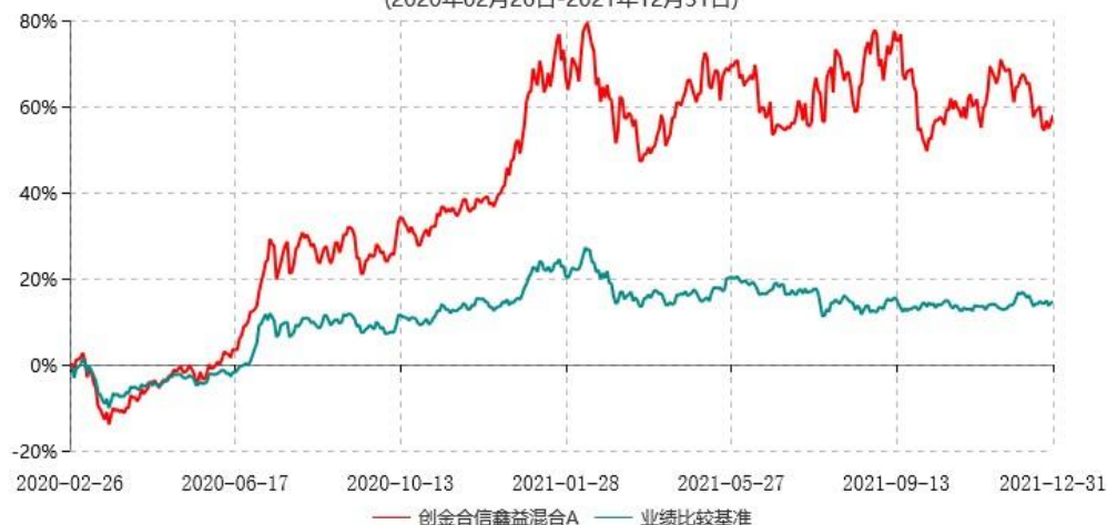
创金合信鑫益混合A累计净值增长率与业绩比较基准收益率历史走势对比图 (2020年02月26日-2021年12月31日)