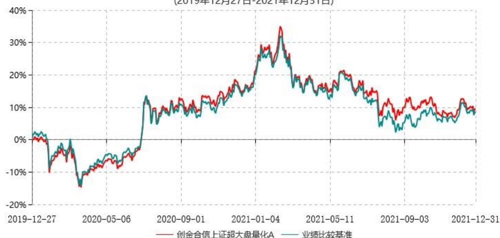
创金合信上证超大盘量化A累计净值增长率与业绩比较基准收益率历史走势对比图 (2019年12月27日-2021年12月31日)