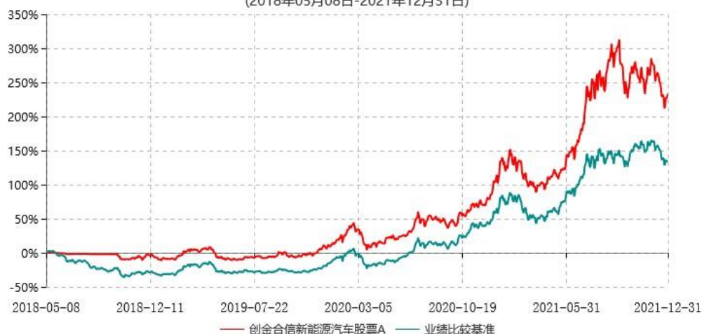
创金合信新能源汽车股票A累计净值增长率与业绩比较基准收益率历史走势对比图 (2018年05月08日-2021年12月31日)