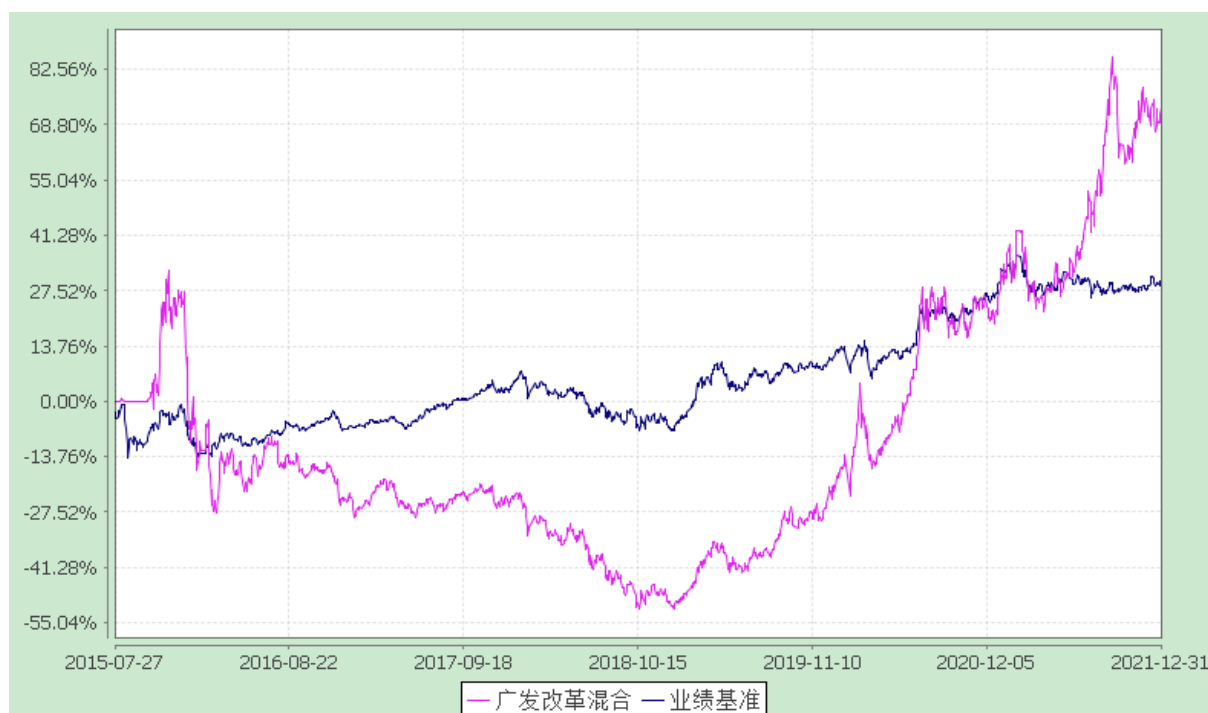
广发改革先锋灵活配置混合型证券投资基金 份额累计净值增长率与业绩比较基准收益率的历史走势对比图 (2015 年 7 月 27 日至 2021 年 12 月 31 日)