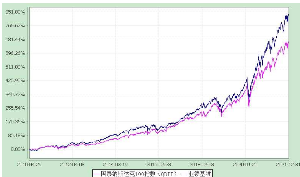
国泰纳斯达克 100 指数证券投资基金 份额累计净值增长率与业绩比较基准收益率历史走势对比图 (2010 年 4 月 29 日至 2021 年 12 月 31 日)

注：（1）本基金合同生效日为 2010 年 4 月 29 日。本基金在六个月建仓期结束时，各项资产配置比例符合合同约定；