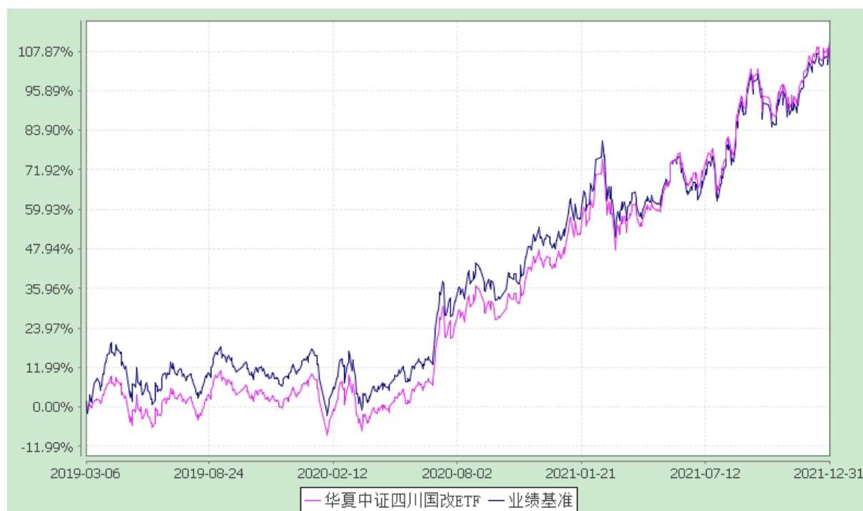
华夏中证四川国企改革交易型开放式指数证券投资基金 份额累计净值增长率与业绩比较基准收益率的历史走势对比图 (2019年3月6日至2021年12月31日)