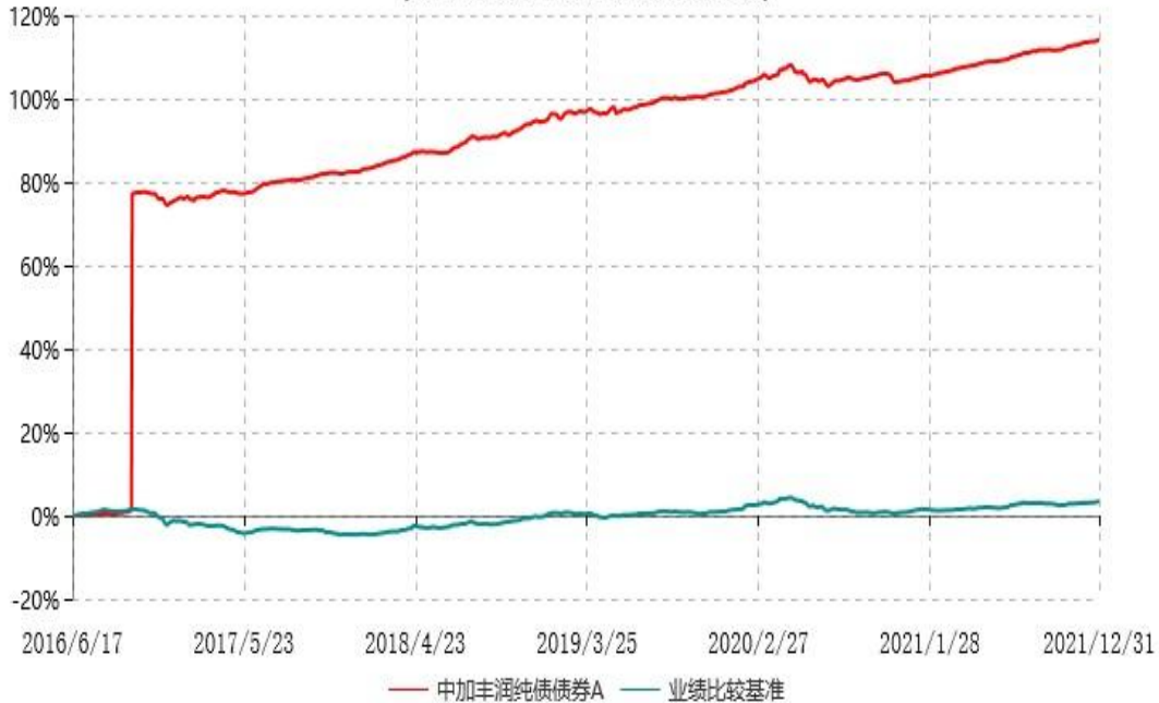
中加丰润纯债债券A累计净值增长率与业绩比较基准收益率历史走势对比图 (2016年06月17日-2021年12月31日)