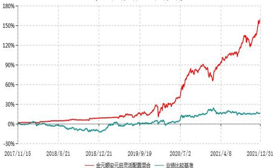
金元顺安元启灵活配置混合型证券投资基金累计净值增长率与业绩比较基准收益率历史走势对比图 (2017年11月14日-2021年12月31日)