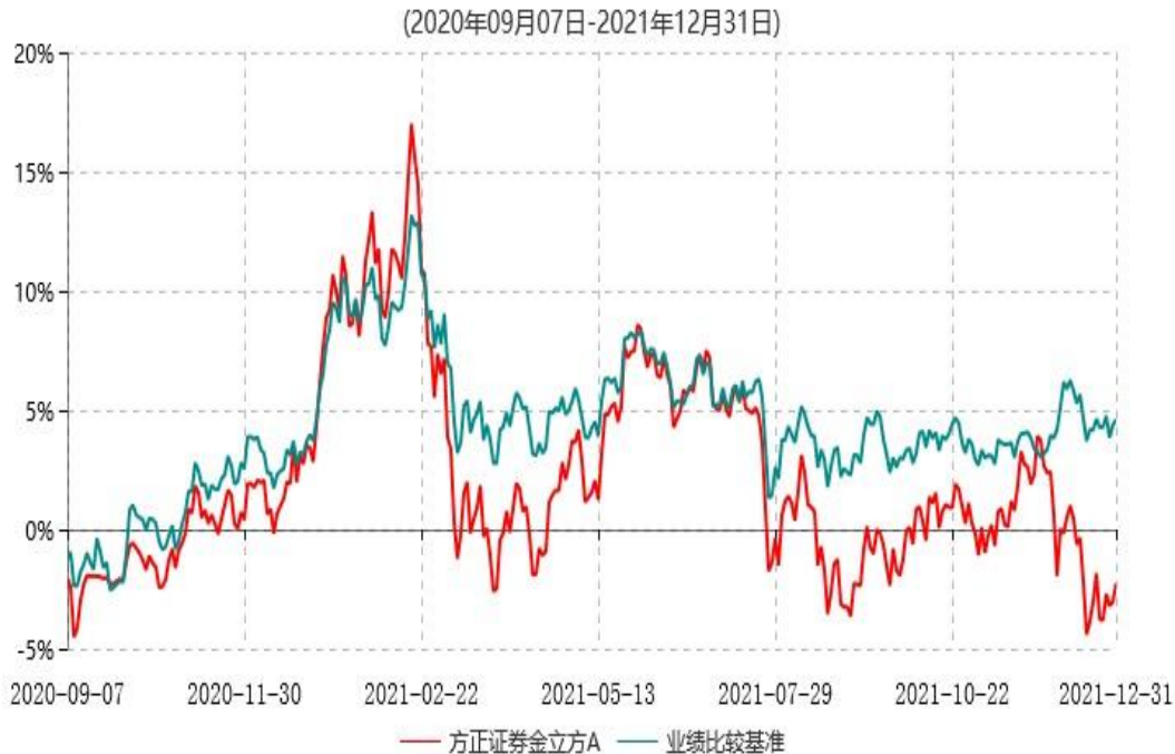
方正证券金立方A累计净值增长率与业绩比较基准收益率历史走势对比图