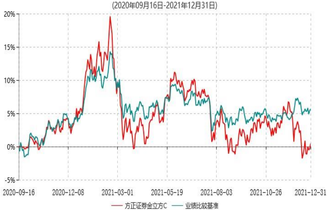
方正证券金立方C累计净值增长率与业绩比较基准收益率历史走势对比图

注：1、基金合同生效日为 2020 年 09 月 07 日，方正证券金立方 C 自 2020 年 9 月 15 日起开放申购和赎回业务。