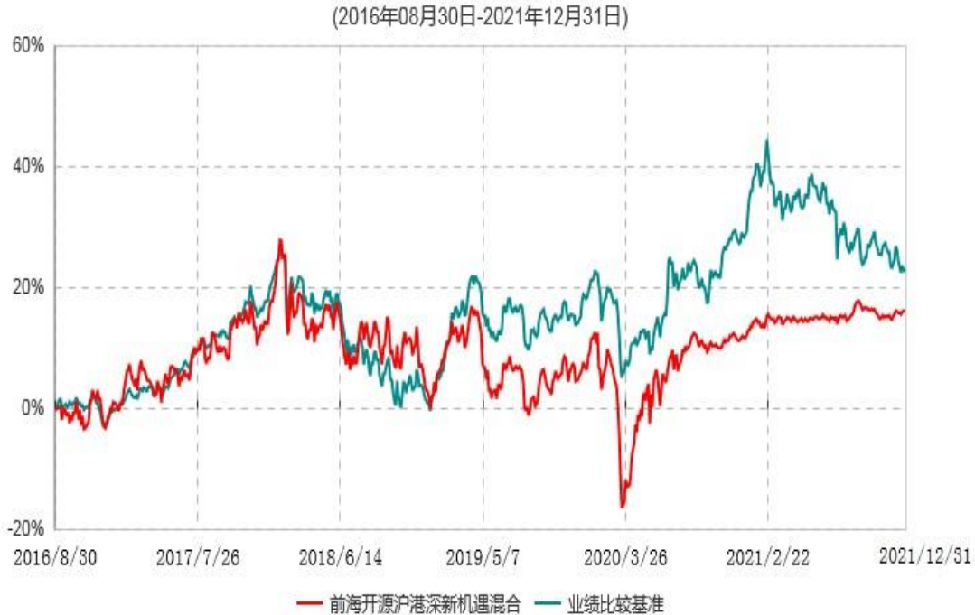
前海开源沪港深新机遇灵活配置混合型证券投资基金累计净值增长率与业绩比较基准收益率历史走势对比图