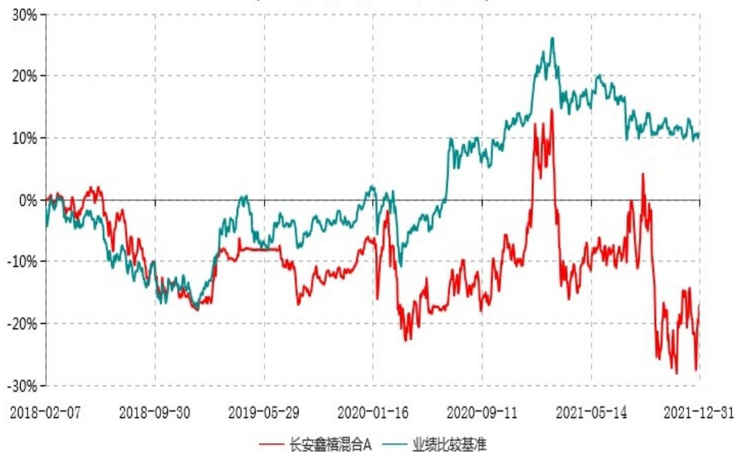
长安鑫禧混合A累计净值增长率与业绩比较基准收益率历史走势对比图 (2018年02月07日-2021年12月31日)

根据基金合同的规定,自基金合同生效之日起6个月内基金各项资产配置比例需符合基金合同要求。本基金在建仓期结束后,各项资产配置比例已符合基金合同有关投资比例的约定。图示日期为2018年02月07日至2021年12月31日。