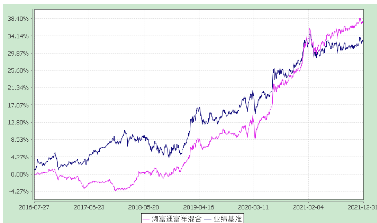
海富通富祥混合型证券投资基金 份额累计净值增长率与业绩比较基准收益率的历史走势对比图 (2016年7月27日至2021年12月31日)

注：本基金合同于2016年7月27日生效，按基金合同规定，本基金自基金合同生效起6个月内为建仓期。建仓期结束时本基金的各项投资比例已达到基金合同第十二部分（二）投资范围、（四）投资限制中规定的各项比例。