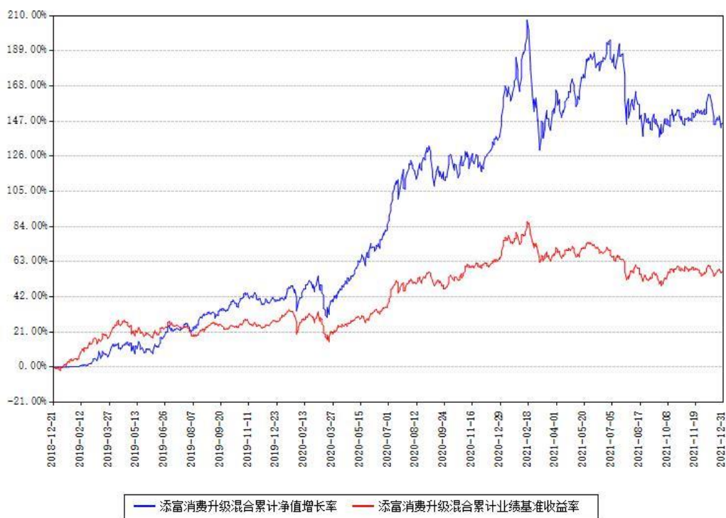
添富消费升级混合累计净值增长率与同期业绩基准收益率对比图

注：本基金建仓期为本《基金合同》生效之日（2018 年 12 月 21 日）起 6 个月，建仓期结束时各项资产配置比例符合合同约定。