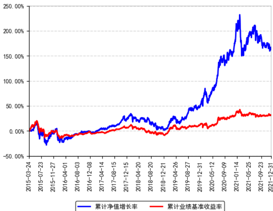
南方创新经济灵活配置混合累计净值增长率与同期业绩比较基准收益率的历史走势对比图