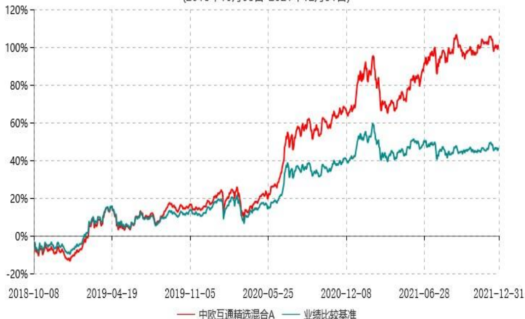
中欧互通精选混合A累计净值增长率与业绩比较基准收益率历史走势对比图 (2018年10月08日-2021年12月31日)

注：自 2018 年 10 月 8 日起，原中欧沪深 300 指数增强型证券投资基金转型为中欧互通精选混合型证券投资基金。图示为 2018 年 10 月 8 日至 2021 年 12 月 31 日。