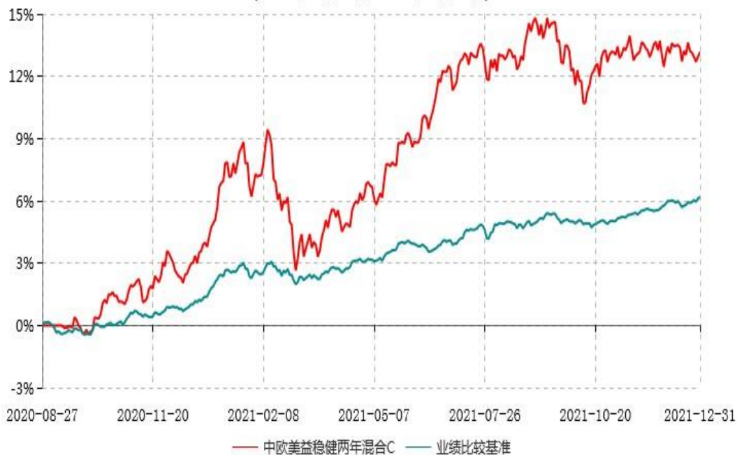
中欧美益稳健两年混合C累计净值增长率与业绩比较基准收益率历史走势对比图 (2020年08月27日-2021年12月31日)

注：本基金基金合同生效日期为 2020 年 8 月 27 日，按基金合同的规定，本基金自基金合同生效起六个月为建仓期，建仓期结束时各项资产配置比例已符合基金合同约定。