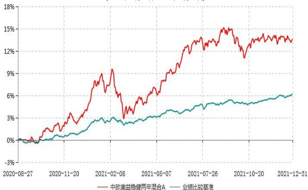
中欧美益稳健两年混合A累计净值增长率与业绩比较基准收益率历史走势对比图 (2020年08月27日-2021年12月31日)

注：本基金基金合同生效日期为 2020 年 8 月 27 日，按基金合同的规定，本基金自基金合同生效起六个月为建仓期，建仓期结束时各项资产配置比例已符合基金合同约定。