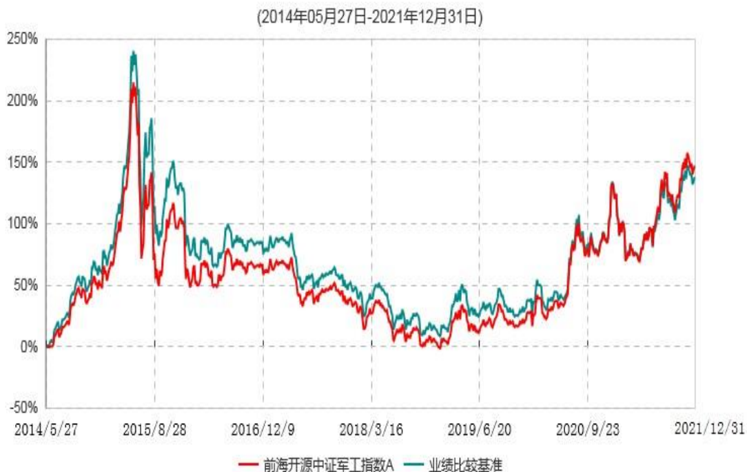
前海开源中证军工指数A累计净值增长率与业绩比较基准收益率历史走势对比图