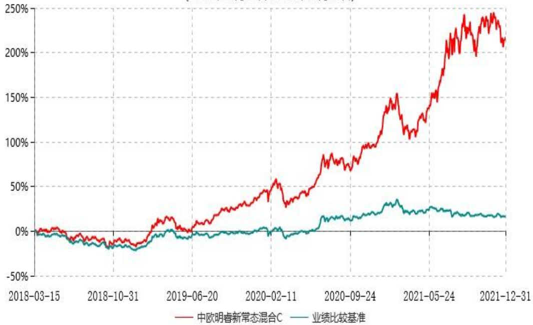
中欧明睿新常态混合C累计净值增长率与业绩比较基准收益率历史走势对比图 (2018年03月15日-2021年12月31日)

注：2021 年 9 月 8 日起组合业绩比较基准变更为沪深 300 指数收益率*60%+中证港股通综合指数(人民币)收益率*20%+中债综合指数收益率*20%。本基金 C 类份额成立日为 2018 年 3 月 14 日，图示日期为 2018 年 3 月 15 日至 2021 年 12 月 31 日。