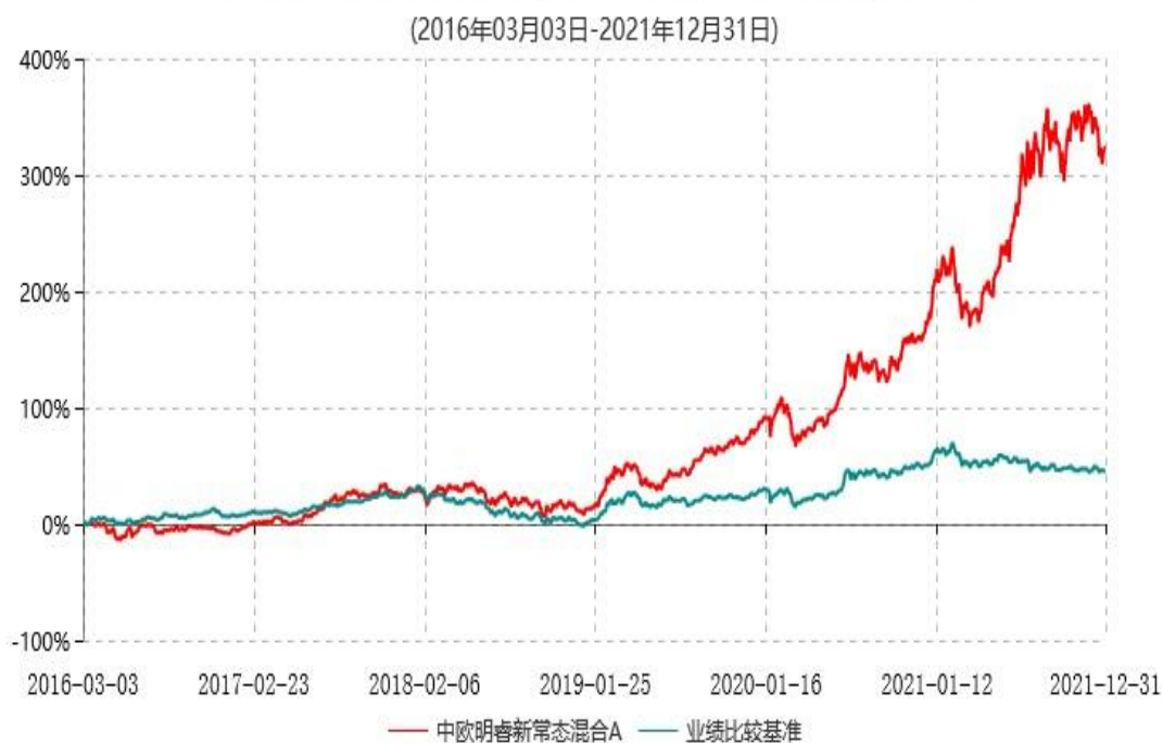
中欧明睿新常态混合A累计净值增长率与业绩比较基准收益率历史走势对比图

注：2021 年 9 月 8 日起组合业绩比较基准变更为沪深 300 指数收益率*60%+中证港股通综合指数(人民币)收益率*20%+中债综合指数收益率*20%。