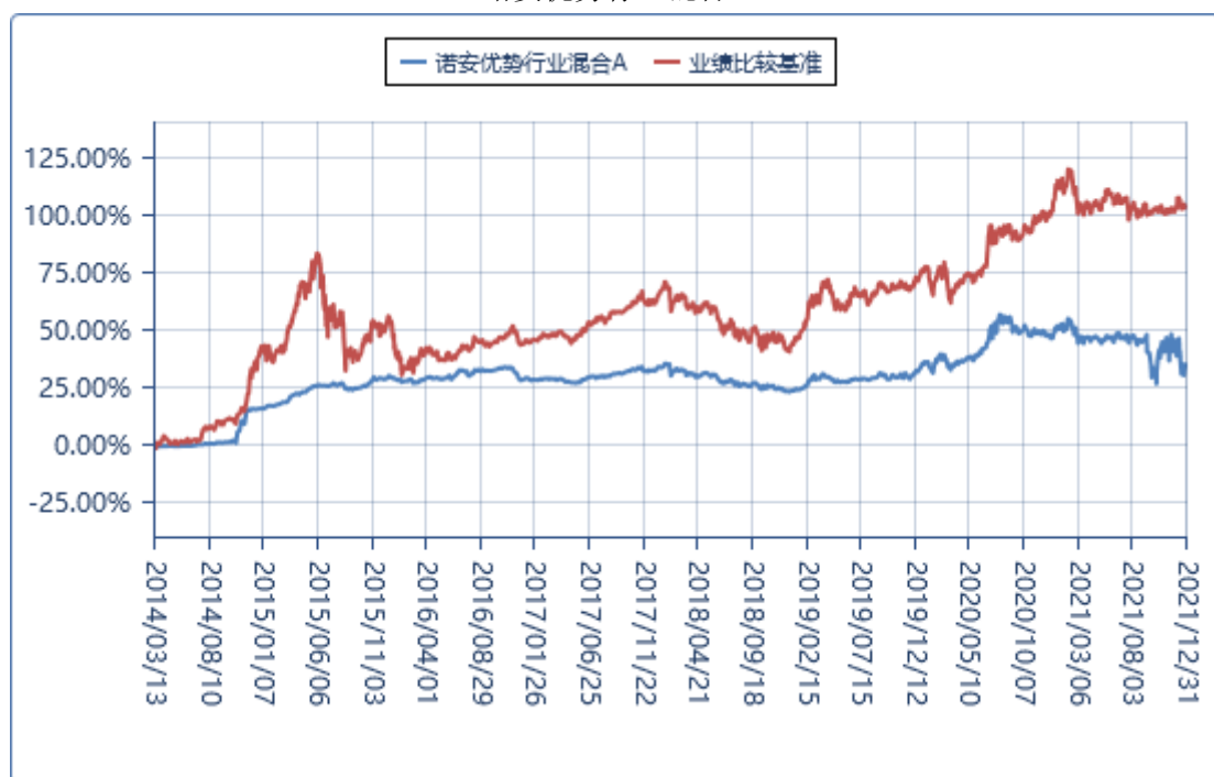
诺安优势行业混合 C