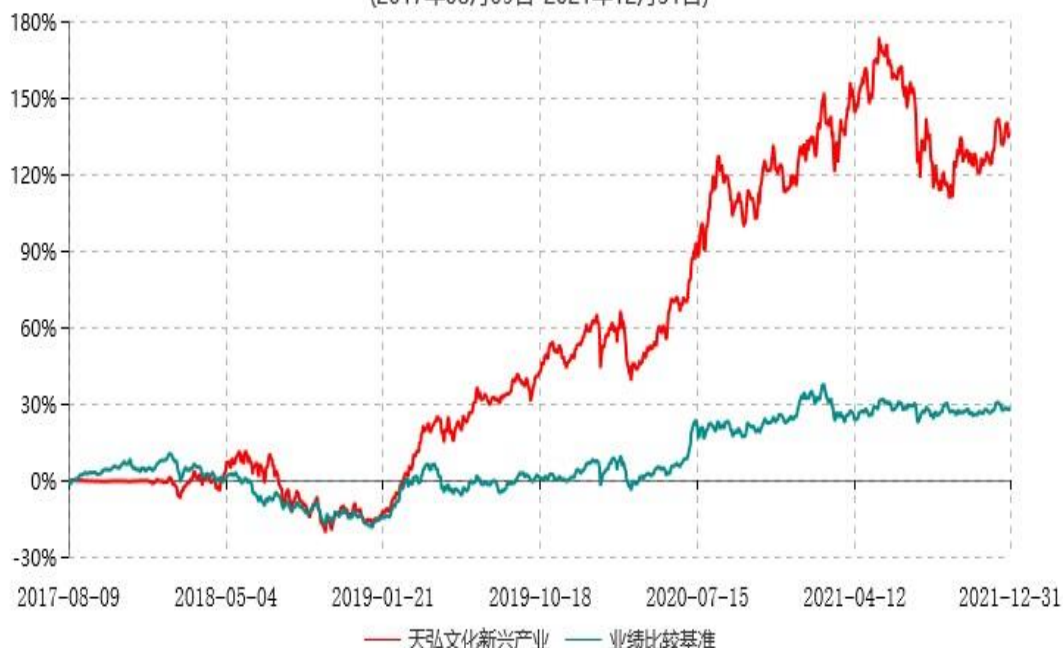
天弘文化新兴产业股票型证券投资基金累计净值增长率与业绩比较基准收益率历史走势对比图 (2017年08月09日-2021年12月31日)

注：1、本基金合同于2017年08月09日生效，本基金于2017年08月09日由天弘鑫动力灵活配置混合型证券投资基金转型而成，名称相应变更为“天弘文化新兴产业股票型证券投资基金”。