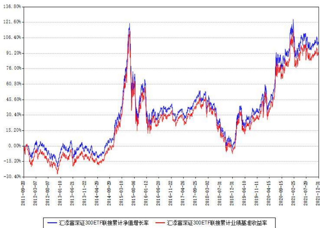
汇添富深证300ETF联接累计净值增长率与同期业绩基准收益率对比图

注：本基金建仓期为本《基金合同》生效之日（2011年09月28日）起6个月，建仓期结束时各项资产配置比例符合合同约定。