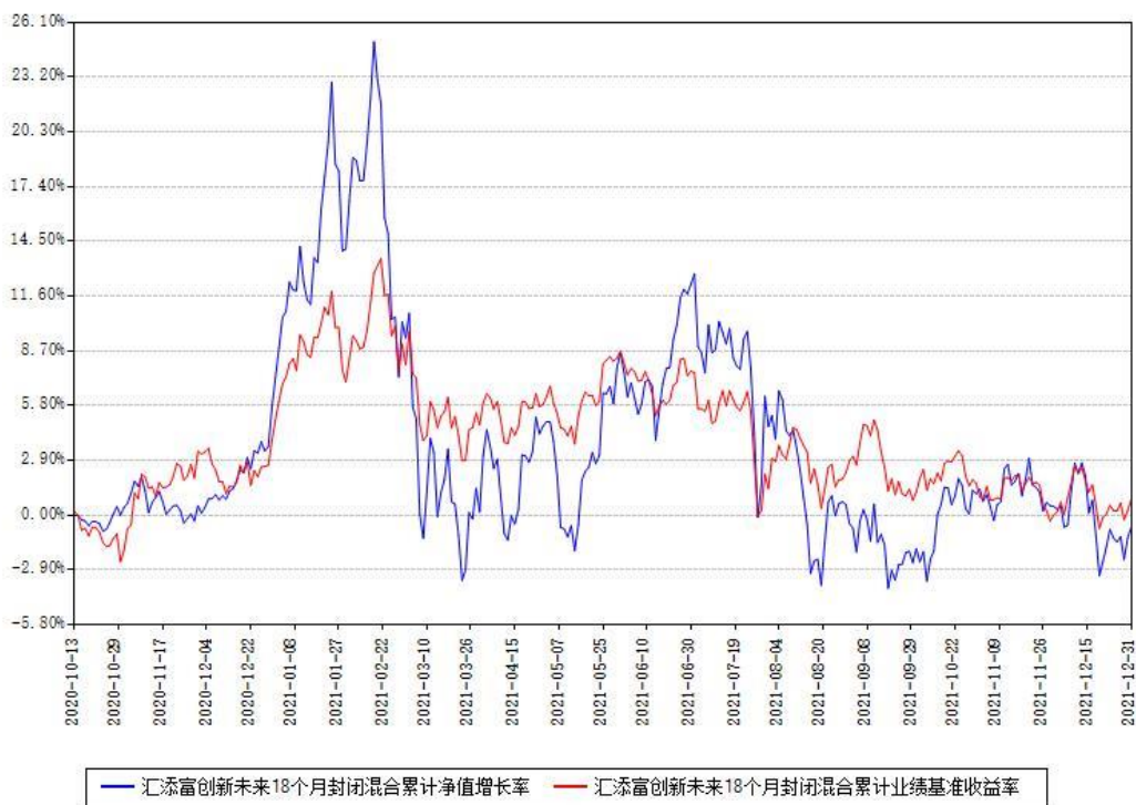
汇添富创新未来18个月封闭混合累计净值增长率与同期业绩基准收益率对比图

注：本基金建仓期为本《基金合同》生效之日（2020年10月13日）起6个月，建仓期结束时各项资产配置比例符合合同约定。