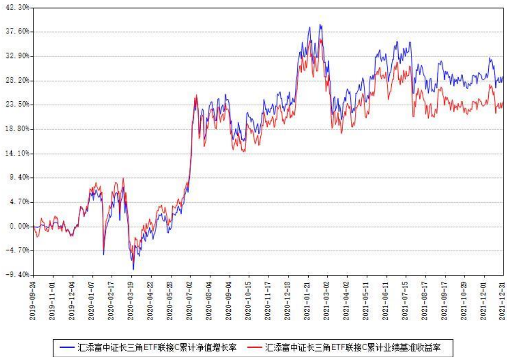
汇添富中证长三角ETF联接C累计净值增长率与同期业绩基准收益率对比图