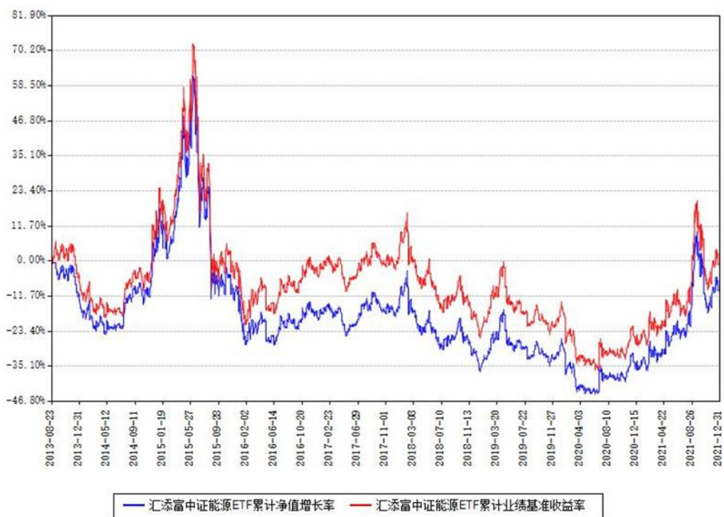
汇添富中证能源ETF累计净值增长率与同期业绩基准收益率对比图