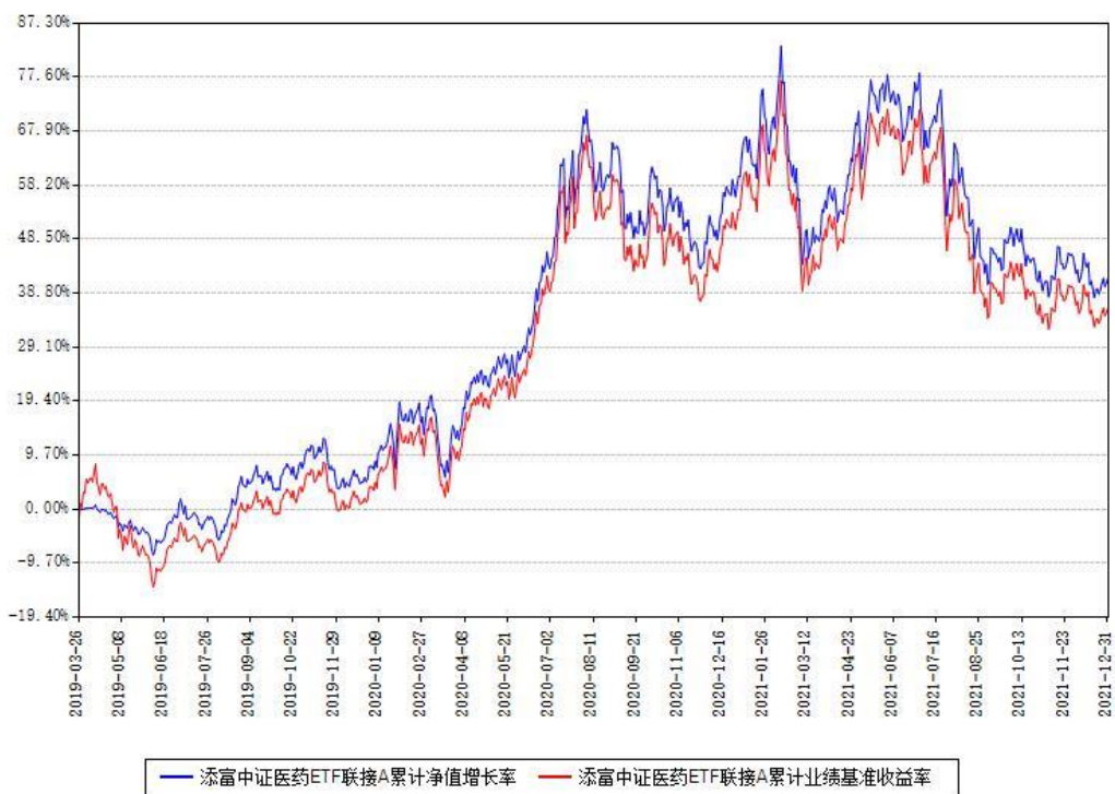
添富中证医药ETF联接A累计净值增长率与同期业绩基准收益率对比图