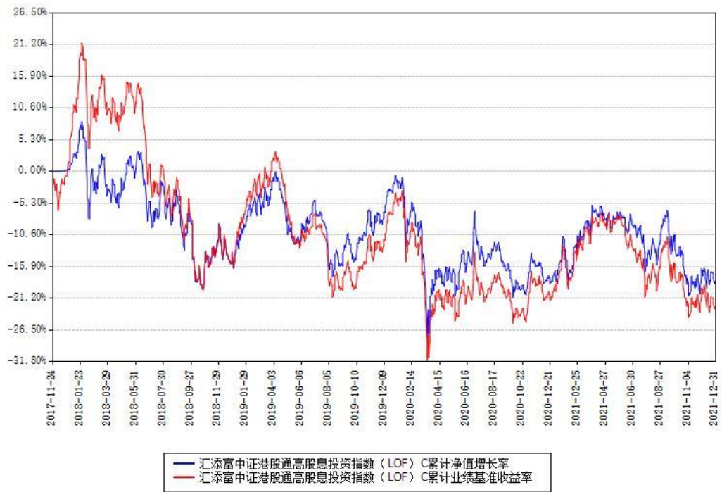
汇添富中证港股通高股息投资指数（LOF）C累计净值增长率与同期业绩基准收益率对比图