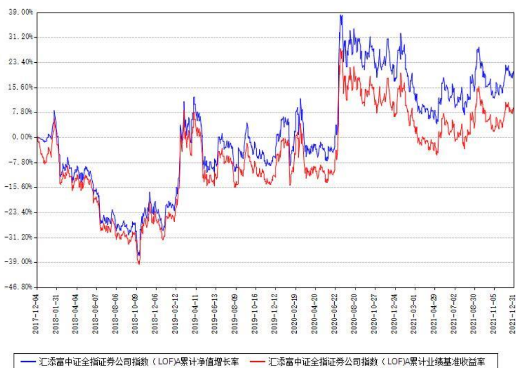
汇添富中证全指证券公司指数（LOF）A累计净值增长率与同期业绩基准收益率对比图

(二)自基金合同生效以来基金累计净值增长率变动及其与同期业绩比较基准收益率变动的比较图