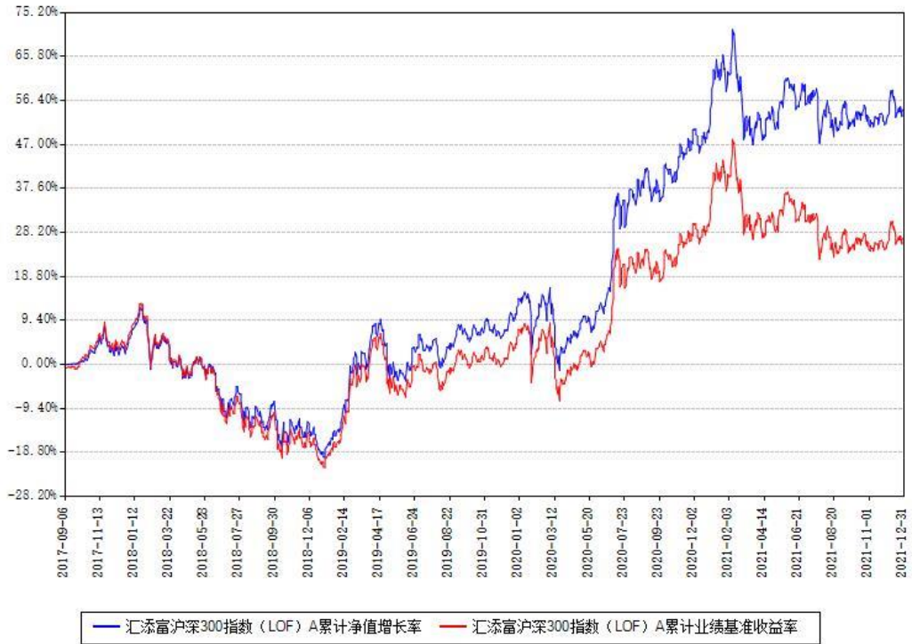
汇添富沪深300指数 (LOF) A 累计净值增长率与同期业绩基准收益率对比图

(二) 自基金合同生效以来基金累计净值增长率变动及其与同期业绩比较基准收益率变动的比较图